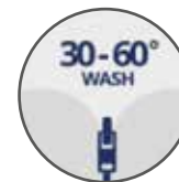
SFODERABILE LAVABILE A 30-60°C