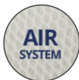
TESSUTO AIR SYSTEM