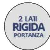
2 LATI RIGIDA PORTANZA SCHIUMATO