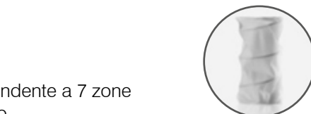
800 MOLLE INDIPENDENTI