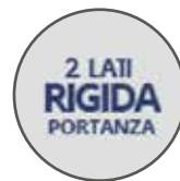
PORTANZA RIGIDA SCHIUMATO