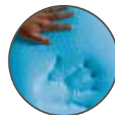
1 LATO MEMORY GEL FRESCO