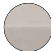
1 LATO SCHIUMATO