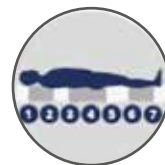
PORTANZA DIFFERENZIATA 7 ZONE