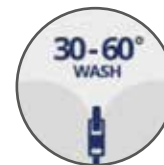
SFODERABILE LAVABILE A 30-60°C