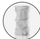
800 MOLLE INDIPENDENTI