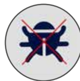
FIBRA ANTIACARO ANALLERGICA